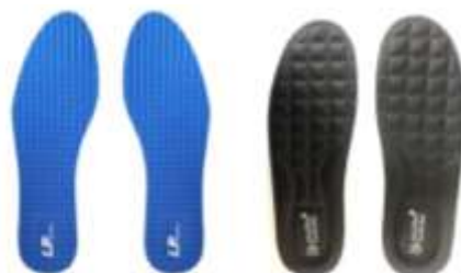
شکل ۱: کفی بافت‌دار درشت و ریز مورد استفاده در پژوهش

پژوهش حاضر از نوع نیمه‌تجربی و آزمایشگاهی بود. نمونه آماری پژوهش حاضر شامل ۲۱ نفر سالمند (۱۵ خانم و ۶ آقا) با میانگین قد ۱۶۴/۱۹۵ سانتی‌متر و وزن ۸۰/۰۴ کیلوگرم و ۶۶/۳۵ سال بودند که به صورت داوطلبانه و در دسترس در پژوهش حاضر شرکت کردند. معیارهای ورود به پژوهش حاضر داشتن حداقل سن ۶۰ سال، توانایی انجام مستقل فعالیت‌های روزمره، سلامت جسمی و ذهنی بود. معیارهای خروج شامل سابقه شکستگی، مشکلات عصبی‌عضلانی، اختلاف طول اندام بیشتر از ۵ میلی‌متر، داشتن عیوب شنوایی و بینایی اصلاح نشده، قطع عضو به علت بیماری و مشکلات موقتی موثر بر تعادل، داشتن سابقه بیماری شدید جسمانی و عضلانی، وابستگی افراد به صندلی چرخ دار و بیماری‌های موثر بر گیرنده‌های حسی عمقی از جمله دیابت بود. پای برتر آزمودنی‌ها توسط آزمون شوت نمودن توپ مشخص شد. جهت شرکت در پژوهش از آزمودنی‌ها رضایت‌نامه کتبی دریافت شد و اخلاق پژوهشی در تمامی مراحل رعایت شد و تمامی موارد اجرای پژوهش مطابق با اعلامیه هلسینکی بود (۲۱). کفی‌های مورد استفاده در این پژوهش از نوع بافت‌دار بود (شکل ۱). کفی‌ها دارای بافت‌های درشت و ریز بودند که این ویژگی دو کفی را از یکدیگر متمایز می‌کرد. کفی‌های مورد استفاده به‌طور کامل بخش جلو، عقب و میانی پا را پوشش می‌داد. متناسب با اندازه پای هر فرد برای هر آزمودنی کفی مناسب استفاده شد.