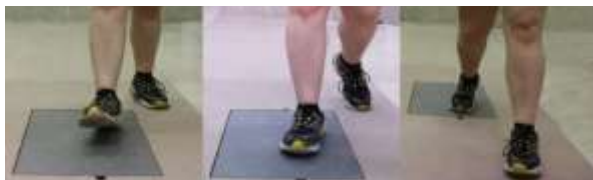
شکل ۲: سه فاز راه‌رفتن شامل برخورد پاشنه، میانه اتکا و جدا شدن پنجه از روی دستگاه صفحه‌نیرو

برای ثبت نیروهای عکس‌العمل زمین از صفحه‌نیروی برتک ساخت ایالات متحده آمریکا با ابعاد ۴۰*۶۰ سانتی‌متر ( Bertec Corporation, Columbus, OH) استفاده شد. نرخ نمونه برداری ۱۰۰۰ هرتز در نظر گرفته شد. داده‌های نیروی عکس‌العمل زمین طی فاز اتکا راه‌رفتن استخراج شد. از فیلتر باتروث با برش فرکانسی ۲۰ هرتز جهت فیلتر کردن داده‌های نیروی عکس‌العمل زمین استفاده شد. پردازش داده‌ها با نرم‌افزار MATLAB صورت گرفت. این نرم‌افزار داده‌های یک سیکل راه‌رفتن را به شیوه ایتروپولیت به صورت ۱۰۱ نقطه طی فاز اتکا راه‌رفتن محاسبه نمود. از آزمودنی‌ها خواستیم تا در مسیر مشخص شده که صفحه‌نیرو را قرار داده‌ایم با سرعت خود انتخابی راه بروند. این آزمون در سه مرحله بدون کفی، با کفی بافت‌دار ریز و کفی بافت‌دار درشت انجام شد. طی هر مرحله، ۳ کوشش راه‌رفتن صورت گرفت. کوشش صحیح شامل برخورد کامل پا (سه فاز راه‌رفتن شامل برخورد پاشنه، میانه اتکا و جدا شدن پنجه از زمین (شکل ۲) بر روی بخش میانی دستگاه صفحه‌نیرو بود. در صورت مورد هدف قرار نگرفتن صفحه‌نیرو توسط آزمودنی و یا اختلال در تعادل آزمودنی کوشش دوباره تکرار می‌شد. در پژوهش حاضر نوع کفش (Adidas) برای تمامی آزمودنی‌ها یکسان و با توجه به شماره پای آن‌ها انتخاب شد. مرکز سلامت دانشگاه محقق اردبیلی به عنوان محل اجرای پژوهش انتخاب شد.