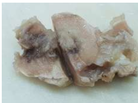
تصویر ۳: عکس ماکروسکوپی توده خارج شده.